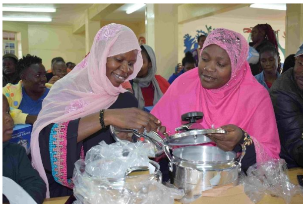
Kenya, Progetto Tuende Pamoja . Mamme alla formazione sull'uso delle pentole a pressione