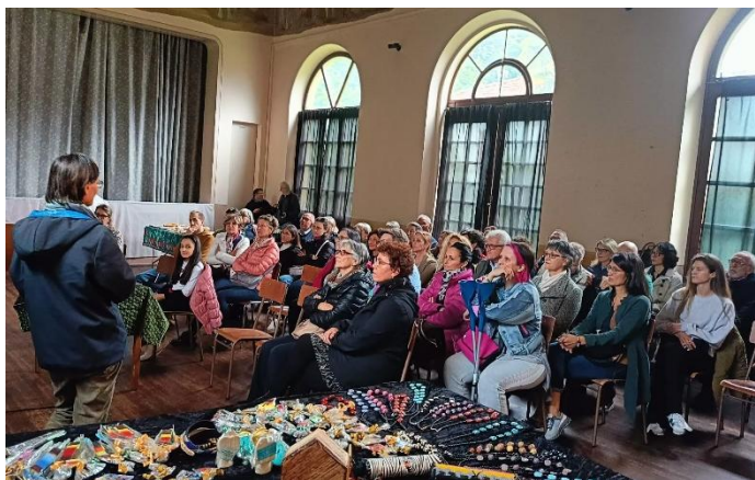
Apericena solidale per il Progetto SAD a Bellinzona