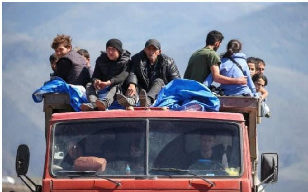
In fuga dal Nagorno Karabakh

136 bambini e bambine molto vulnerabili, anche con disabilità, provenienti da campi rifugiati o in famiglie sfollate, hanno partecipato a momenti di arteterapia e musicoterapia.