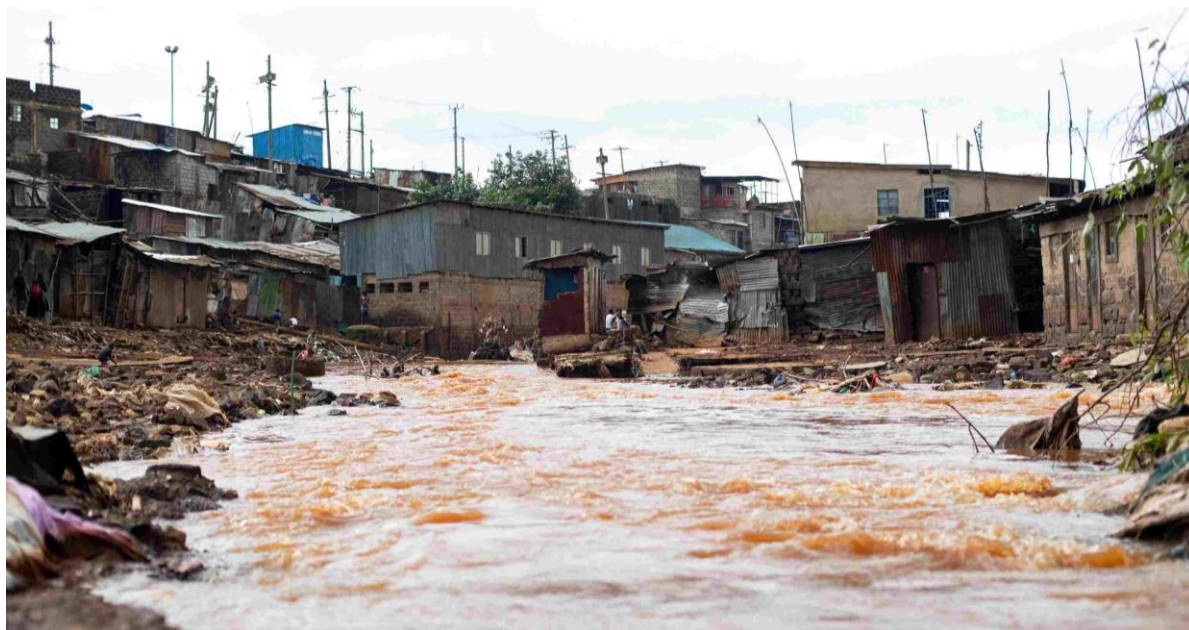
Allagamento nello slum di Kibera, Nairobi, Kenya

Nel periodo tra aprile e maggio 2024 , in Kenya si sono verificate piogge eccezionali. Esse hanno provocato gravi danni nel Paese ed hanno colpito in particolare la zona di Nairobi dove, oltre al Progetto Sostegno a Distanza era in corso il Progetto Tuende Pamoja , nonché altri progetti educativi a sostegno di scuole. Molte famiglie hanno perso la casa . AVSI Kenya ha perciò chiesto aiuto per portare sollievo alle famiglie colpite. AVAID ha quindi lanciato un appello alla sua rete raccogliendo varie donazioni. Tali fondi sono stati utilizzati da AVSI Kenya per il sostegno a 50 famiglie dello slum di Korogocho che hanno perso l'abitazione. Gli aiuti hanno permesso il pagamento di un riparo in affitto e la distribuzione di kit igienici e voucher per alimenti a 392 famiglie di diversi quartieri poveri, tra cui quello di Kibera.