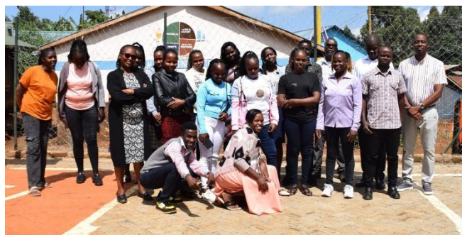
Kenya, Mutuati. Gli insegnanti della Scuola S. Pampuri

Shelter Hopespring Star Academy : 3 insegnanti