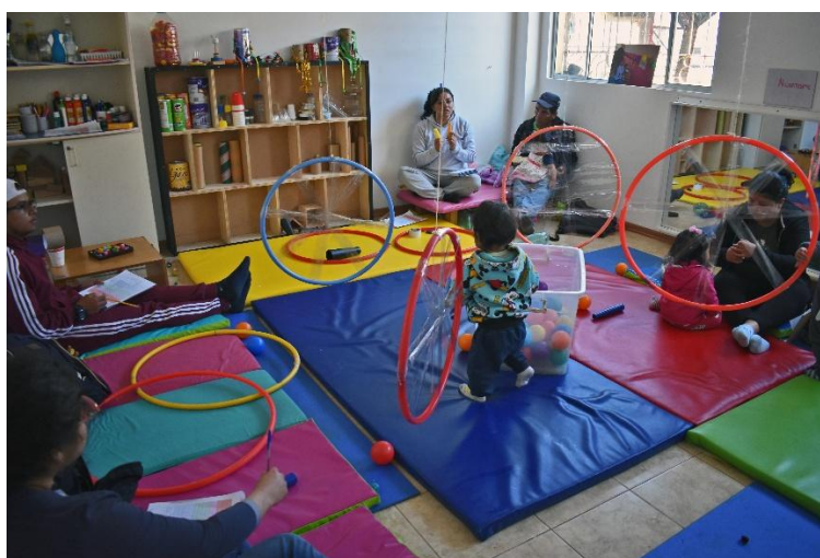
PELCA. Genitori e figli coinvolti in attività di gioco e abilità cognitive

Sono poi state organizzate giornate aperte alla comunità, in cui i genitori e i bambini si sono dedicati ad attività di integrazione comunitaria.