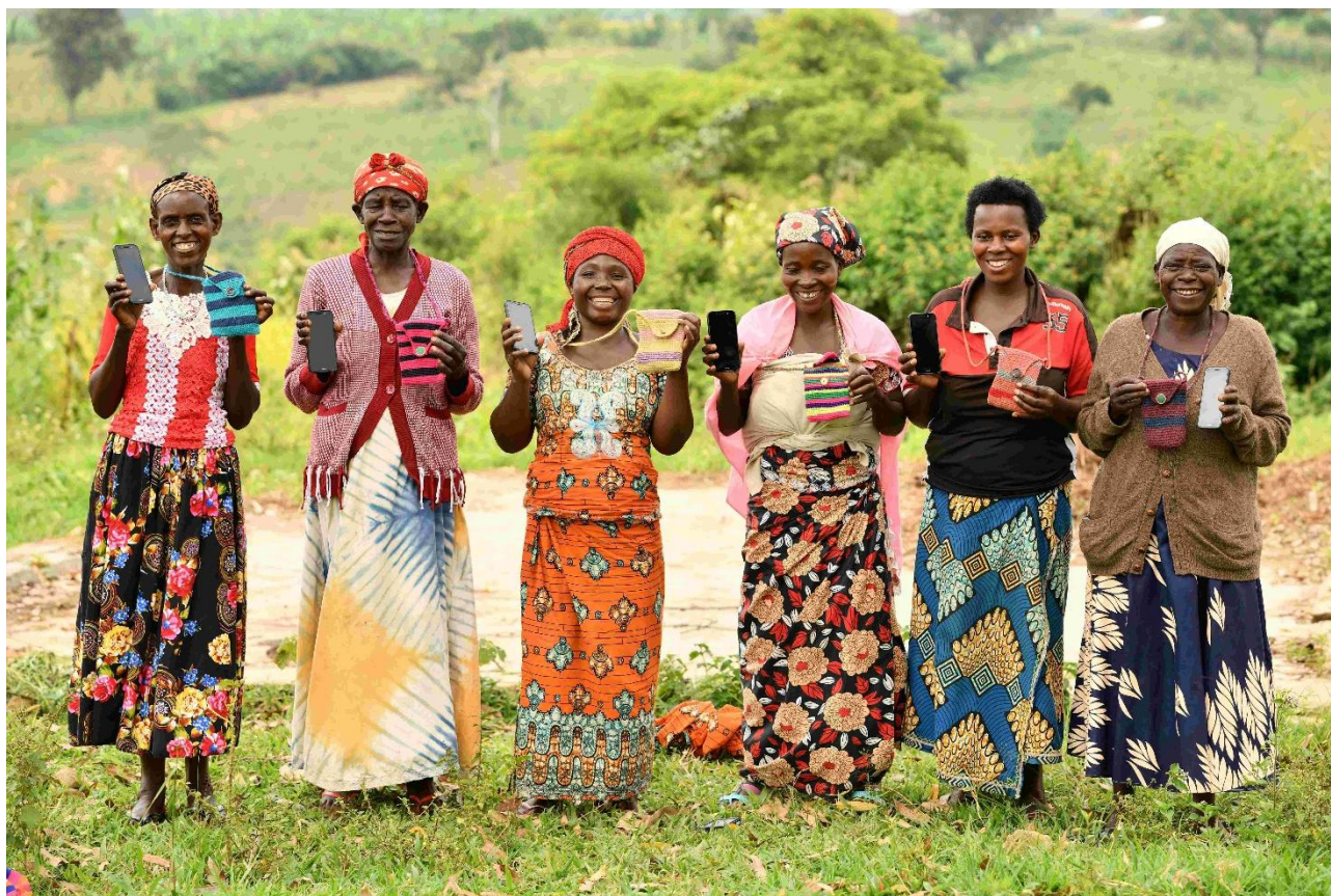
Progetto rafforzamento delle capacità di un gruppo di organizzazioni comunitarie di base in Uganda