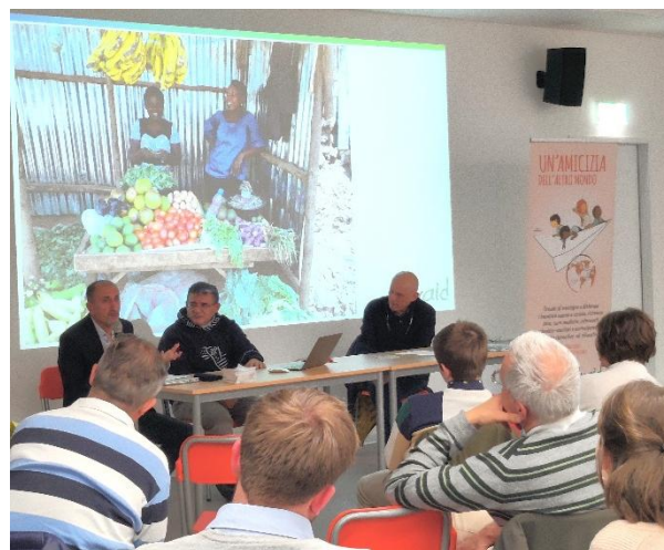
Bambini nel mondo, questioni da grandi. Incontro alla Scuola Piccolo Principe di Porza