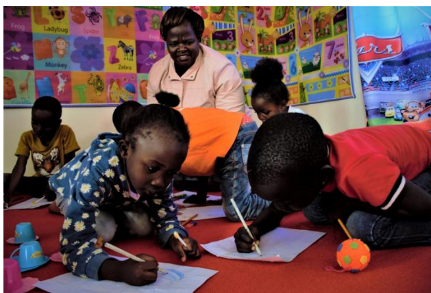
Sessione di arteterapia con bambini del Progetto SAD

Le sessioni di arteterapia, condotte dagli educatori di AVAID, hanno supportato i bambini nell'elaborazione di traumi e nella gestione di difficoltà comportamentali come sbalzi d'umore, isolamento, aggressività e scarsa concentrazione in classe. Questa metodologia si è dimostrata particolarmente efficace nel promuovere il benessere emotivo dei bambini e nel migliorare il loro rendimento scolastico.