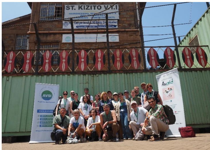
Il gruppo di sostenitori dall'Europa in visita in Kenya