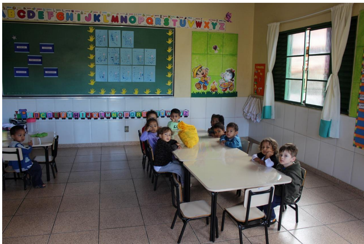
Belo Horizonte, Brasile. Bambini delle Obras Educativas pronti per la merenda