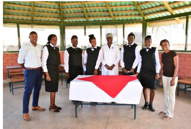
Corso di catering, Istituto professionale St. Kizito, Nairobi, progetto IDEA Aula prove, progetto Accentus 2019

Un contributo annuale fisso da parte di gruppi, famiglie, persone, enti, per permettere a bambine/i e ragazze/i di accedere ad ogni ordine di scuola, alle cure sanitarie, di ricevere cibo e beni di prima necessità. Tutto questo attraverso un progetto pluriennale, che prevede l'accompagnamento di operatori sociali che monitorano la situazione dei giovani e delle loro famiglie, comunicando con i sostenitori, che ricevono corrispondenza puntuale almeno due volte all'anno.