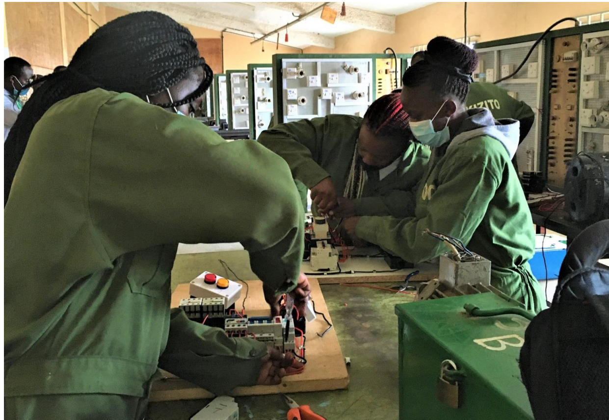
Ragazze del St. Kizito Vocational Training Institute, Nairobi

AVAID - Association de Volontaires pour l'Aide au Développement - Associazione Volontari per l'Aiuto allo Sviluppo – www.avid.ch - è una ONG - organizzazione non governativa - svizzera, senza scopo di lucro, con sede a Lugano. Costituita nel 1995 con la missione di promuovere la dignità della persona attraverso attività di cooperazione allo sviluppo, con particolare attenzione al settore dell'educazione e della formazione , AVAID è attiva in vari Paesi del mondo con progetti a favore dell'infanzia, dei giovani e delle famiglie e promuove collette mirate in situazioni di emergenza.